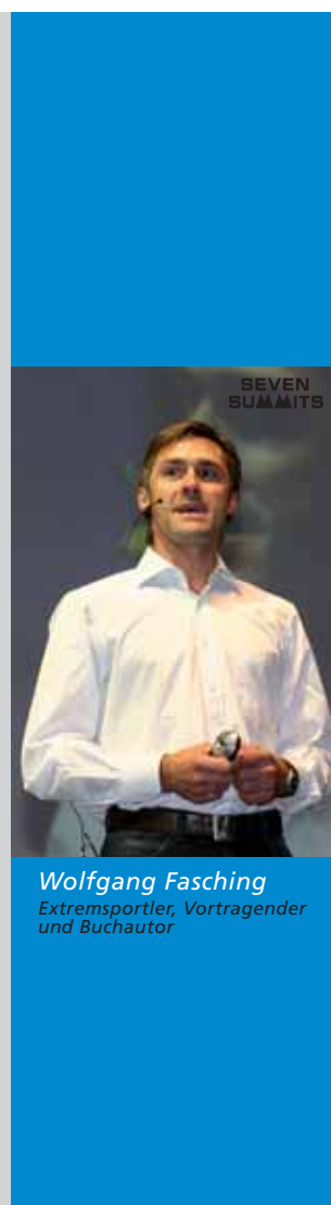
Wolfgang Fasching Extremsportler, Vortragender und Buchautor

Freuen Sie sich auf einen interessanten Impulsvortrag von Wolfgang Fasching und die anschließende Mountainbike-Verlosung!